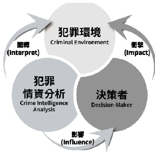
情資主導警政「三I模式」

國土安全時期的警察勤務理論中之「情資導向警政 (Intelligence-led Policing)」(參：中央警察大學，警察政策研究所，中央警察大學學報第六十期，民 112，1~22，孫義雄，〈警政策略思想理路之演變〉/ https://tpl.ncl.edu.tw/NclService/pdfdownload?filePath=IV8OirTfsslWcCxIpLbUfhQHstx_oOBL1iuwzeqpB9ees5vDJtnAbYnIpFlarHdP&imgType=Bn5sH4BGpJw=&key=WPzrsEMsWZgVEYtUZdtkT1KpCpIGhAJj5JnErFLVU24eVVU9OyINO4qBZJhLTxWd&xmlId=0007783761 )：Ratcliffe 在考察各國運作方式之後的歸納，並由「犯罪環境」(Criminal Environment)、「犯罪情資分析」(Crime Intelligence Analysis)、「決策者」(Decision-Maker)等三個核心主體，以及「闡釋」(Interpret)、「影響」(Influence)、「衝擊」(Impact)等三個運作過程要素組合而成的「三I模式」，以之詮釋情資主導警政 (Ratcliffe, 2016)。